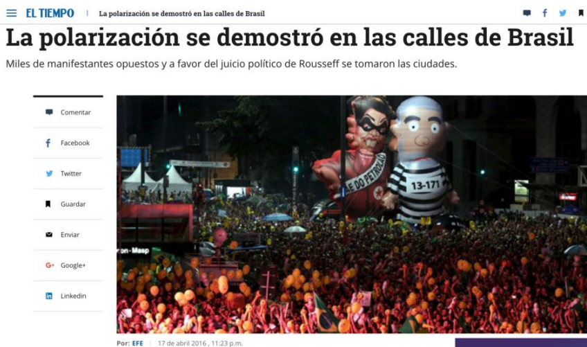
Figura 1 - Fotografía en que manifestantes muestran muñecos de Dilma y Lula detenidos

Este aspecto se refuerza con los apoyos gráficos empleados en las publicaciones de este diario. En este sentido, aunque la mayor parte de los contenidos de El Tiempo sea neutral, las fotografías utilizadas para apoyar la información textual tienen una connotación negativa de la imagen de Rousseff o de su partido en todas las publicaciones. El 69% de los textos incluyen imágenes, que presentan fotos en que la expresidenta aparece con afecciones de brava o con apariencia de una persona desequilibrada, del expresidente Lula da Silva irritado o de presidentes latinoamericanos de izquierda que apoyaron Rousseff, como Evo Morales. En “La polarización se demostró en las calles de Brasil”, del 17 de abril de 2016, a pesar de ser una crónica neutral, la imagen de los manifestantes muestra los muñecos de Dilma y Lula detenidos (figura 1).