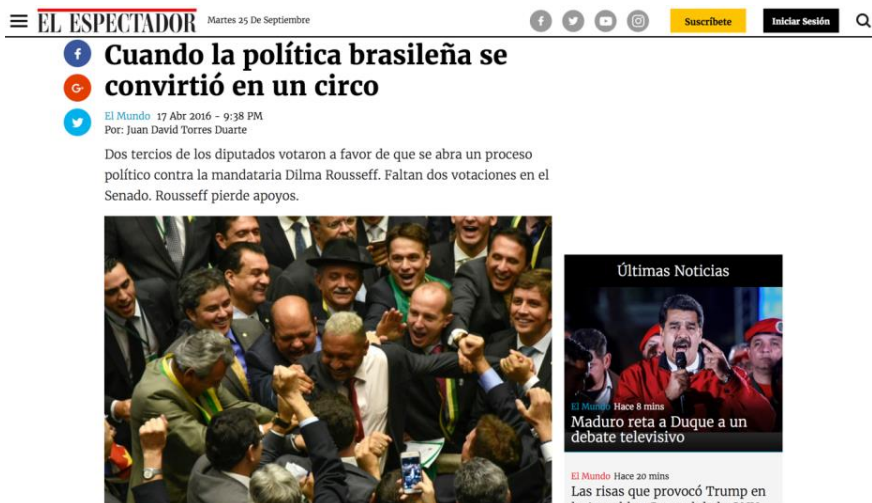
Figura 2 - Fotografía en que la oposición conmemora la aprobación del impeachment

Con relación a las fotografías, si bien el día en que se votó la destitución se presentó una imagen de los diputados opositores celebrando el triunfo (figura 2), el encuadre de la publicación está más en contra del impeachment que en resaltar los beneficios de la destitución de la entonces presidente brasileña.